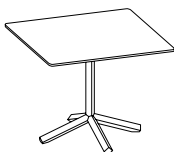
Table Ht. 105 cm. Plateau carré L. 70 x P. 70 cm

Table Ht. 74 cm. Plateau carré L. 90 x P. 90 cm