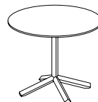
Table Ht. 105 cm. Plateau rond Ø 70 cm