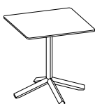
Table Ht. 74 cm. Plateau carré L. 90 x P. 90 cm

Table Ht. 74 cm. Plateau carré L. 70 x P. 70 cm