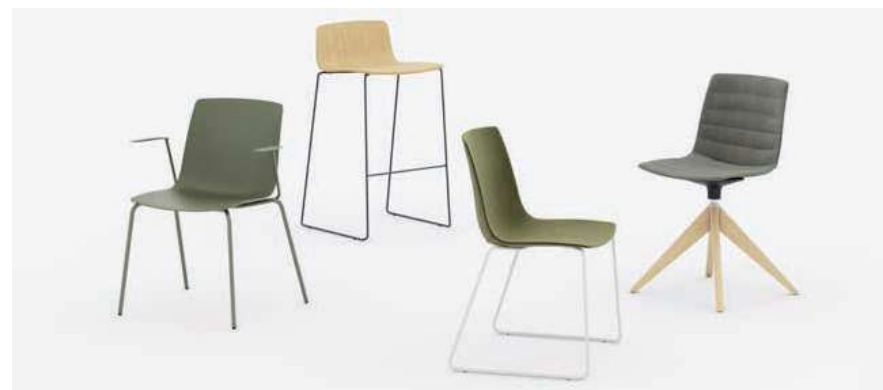
Polipropilene | Polypropylene | Polypropylène L4G5, Remix 3 R1R2, Rovere naturale | Natural oak | Chêne naturel