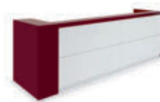
L360 P75 H109