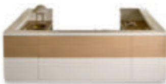
L340 P275 H109