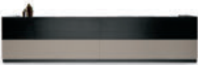
L460 P75 H109

Possible options/Anbaukompositionen/Combinaisons/Composiciones