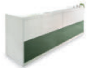
L320 P75 H109