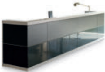
L460 P75 H109